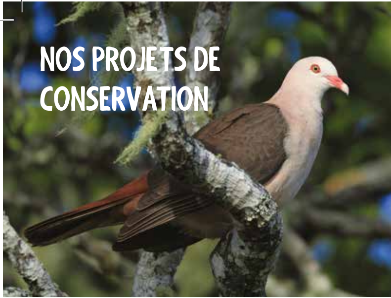
Pigeon des Mares