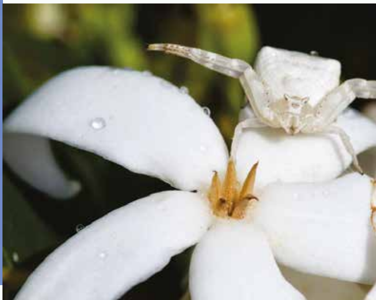
Café Marron (Rodrigues)