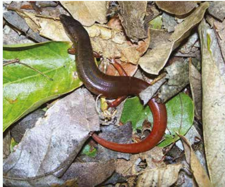
Scinque à queue orange

Le travail de conservation commencé dans les années 1970, et intensifié dès 1984, a permis de sauver de l'extinction la grosse câteau verte, le pigeon des Mares et la crécerelle de Maurice, des projets qui ont obtenu une notoriété internationale.