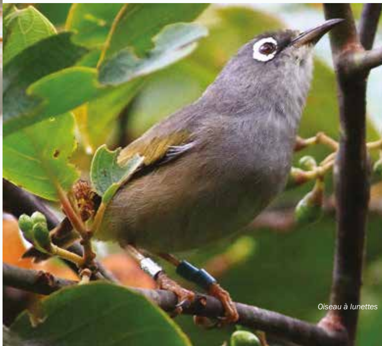
Oiseau à Lunettes

Dans ce sens, nous voulons être à l'écoute des acteurs de la société. C'est la raison pour laquelle nous souhaitons rencontrer les responsables CSR afin de discuter ensemble de la meilleure façon d'engager un partenariat adapté à leurs philosophies.