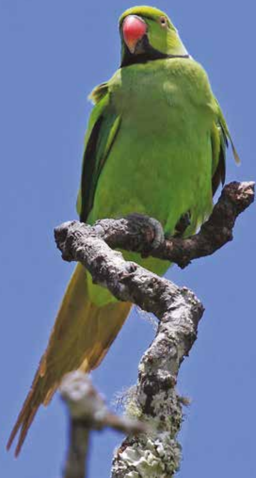
Grosse Cateau Verte

Si vous souhaitez en savoir plus sur nos différents projets ou nous soutenir, n'hésitez pas à rentrer en contact avec nous :