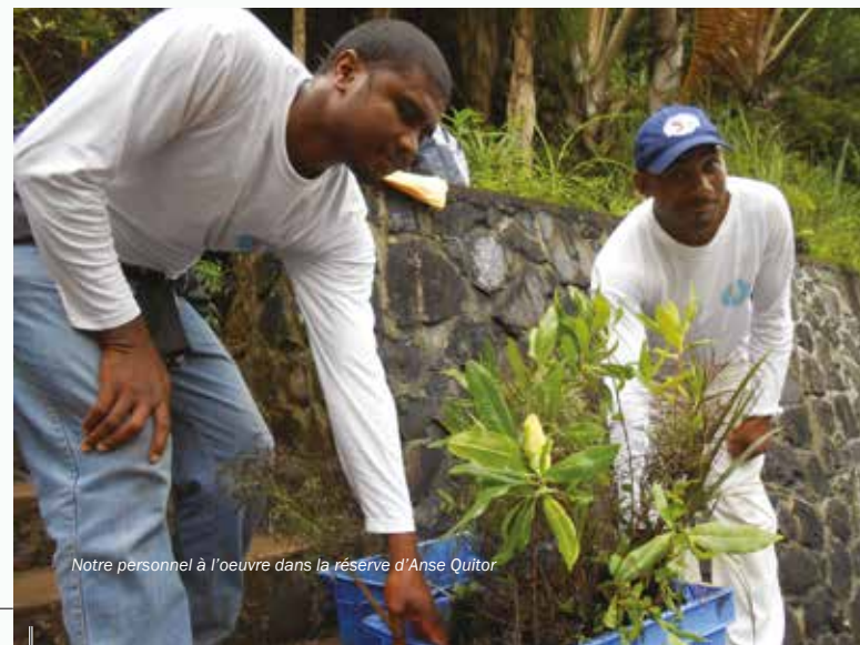
Notre personnel à l'oeuvre dans la réserve d'Anse Quito