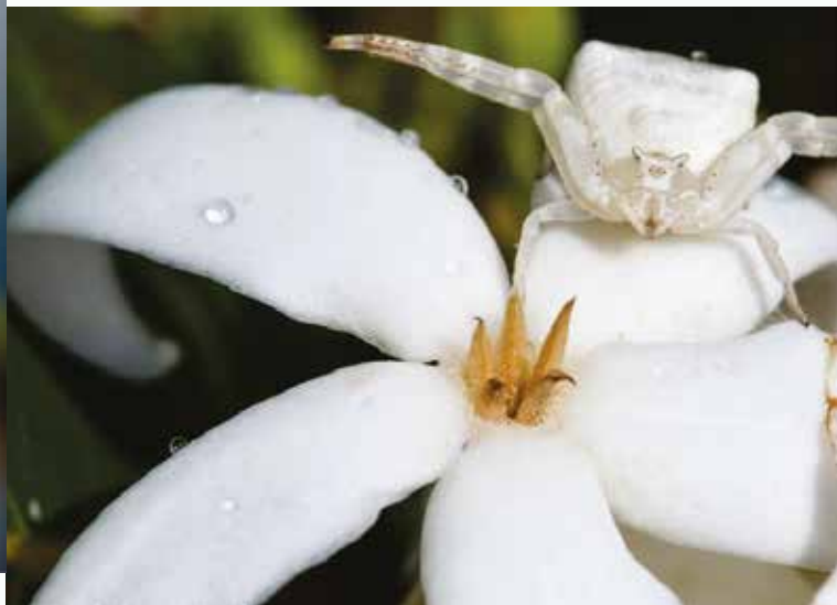
Café Marron (Rodrigues)