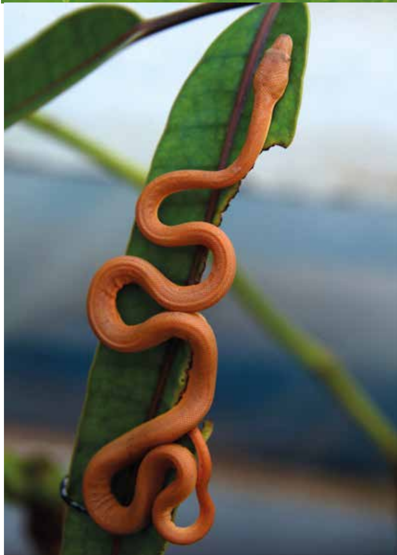
Boa de l'île Ronde

Si vous souhaitez en savoir plus sur nos différents projets ou nous soutenir, n'hésitez pas à nous contacter sur :