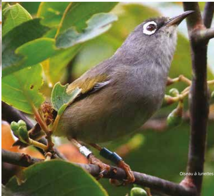
Oiseau à lunettes

Dans ce sens, nous voulons être à l'écoute des acteurs de la société. C'est la raison pour laquelle nous souhaitons rencontrer les responsables CSR afin de discuter ensemble de la meilleure façon d'engager un partenariat adapté à leurs philosophies.